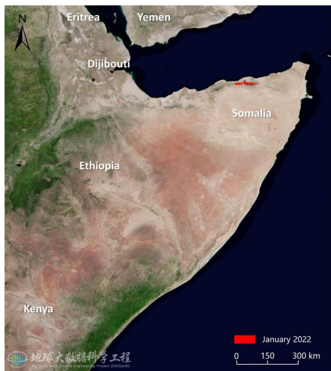
图 1 索马里沙漠蝗危害区域遥感监测图 (2022 年 1 月)

综合分析表明, 2022 年 2 月, 随地面控制的持续进行, 索马里境内沙漠蝗群的规模与数量相对去年同期将显著减少。预测显示, 索马里境内蝗虫会进一步产卵繁殖并成熟, 但受干燥的气候条件影响, 预计蝗虫数量将进一步减少。2022 年 2 月正值索马里地区粮食作物的重要生长季, 继续保持地面调查及控制行动, 以保障索马里的农牧业生产及粮食安全。