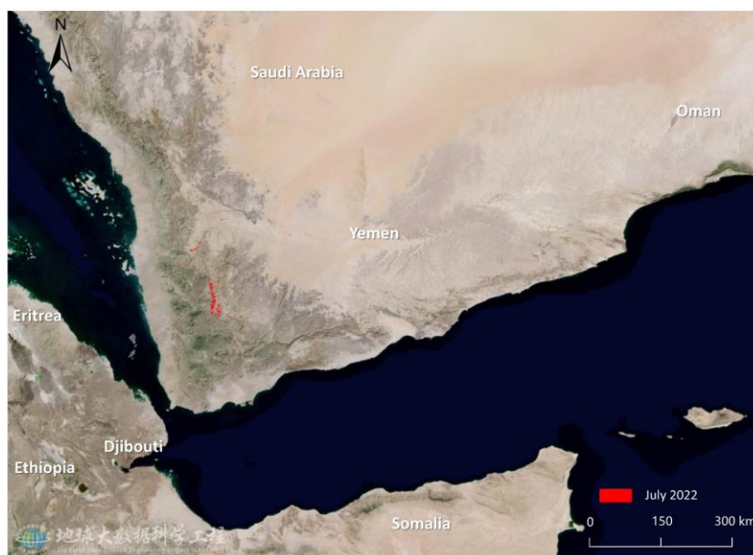
图 1. 也门沙漠蝗危害区域遥感监测图（2022 年 7 月）

2022年7月，受降雨影响，也门西部地区的蝗虫不断产卵繁殖并成熟，导致蝗虫数量增多，植被危害面积为5.71万公顷，其中农田1.01万公顷，草地0.57万公顷，灌丛4.13万公顷（图1）。综合分析表明，预计8月下旬至9月，受降雨影响，也门西部地区蝗虫将继续产卵繁殖并成熟，导致蝗虫数量进一步增多；该时期为也门粮食作物的重要生长季和收获季，需持续开展蝗虫动态监测，以保障也门农牧业生产及粮食安全。