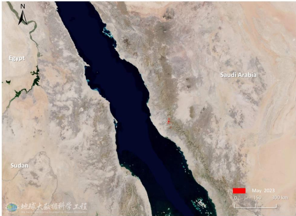
图 2. 沙特阿拉伯沙漠蝗危害区域遥感监测图（2023 年 5 月）

本次研究同时应用 Sentinel-2 卫星遥感数据对沙特阿拉伯西部红海沿岸受灾较严重区域进行灾情监测（图 3）。研究区位于麦加区（Makkah），西北距麦加（Makkah）40.3 公里，南距阿尔利斯（Al Lith）80.0 公里。研究区的植被总面积为 27.56 千公顷，植被受灾面积为 10.36 千公顷，占研究区植被总面积的 37.6%。其中，农田受灾面积为 4.51 千公顷，草地受灾面积为 1.01 千公顷，灌丛受灾面积为 4.84 千公顷，分别占研究区农田、草地和灌丛总面积的 60.1%、63.9%和 26.2%。