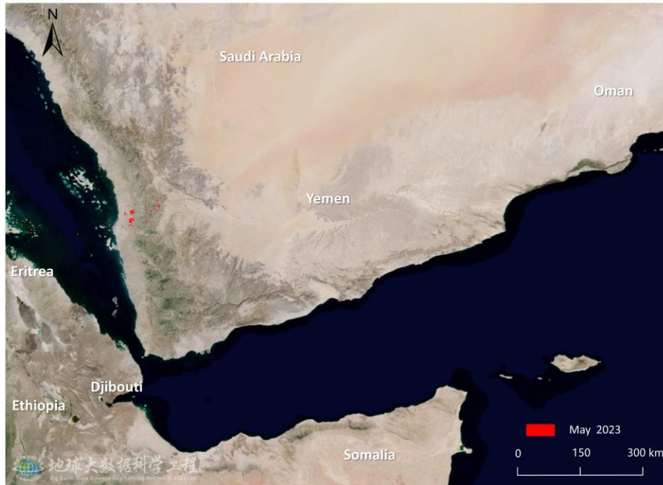
图 1. 也门沙漠蝗危害区域遥感监测图（2023 年 5 月）

监测结果显示，2023年5月沙漠蝗危害也门植被面积4.03万公顷，其中危害农田0.13万公顷，危害草地0.84万公顷，危害灌丛3.06万公顷（图1），分别占全国农田、草地和灌丛总面积的0.2%、2.9%和0.8%。与4月相比，新增危害植被面积2.87万公顷（其中，农田0.13万公顷，草地0.66万公顷，灌丛2.08万公顷）。其中，哈杰省（Hajjah）植被受灾面积最大，为2.20万公顷；其次为阿姆兰省（Amrān），植被受灾面积为1.03万公顷；荷台达省（Al-Hudaydah）和焦夫省（Al Jawf）植被受灾面积分别为0.75万公顷和0.05万公顷。