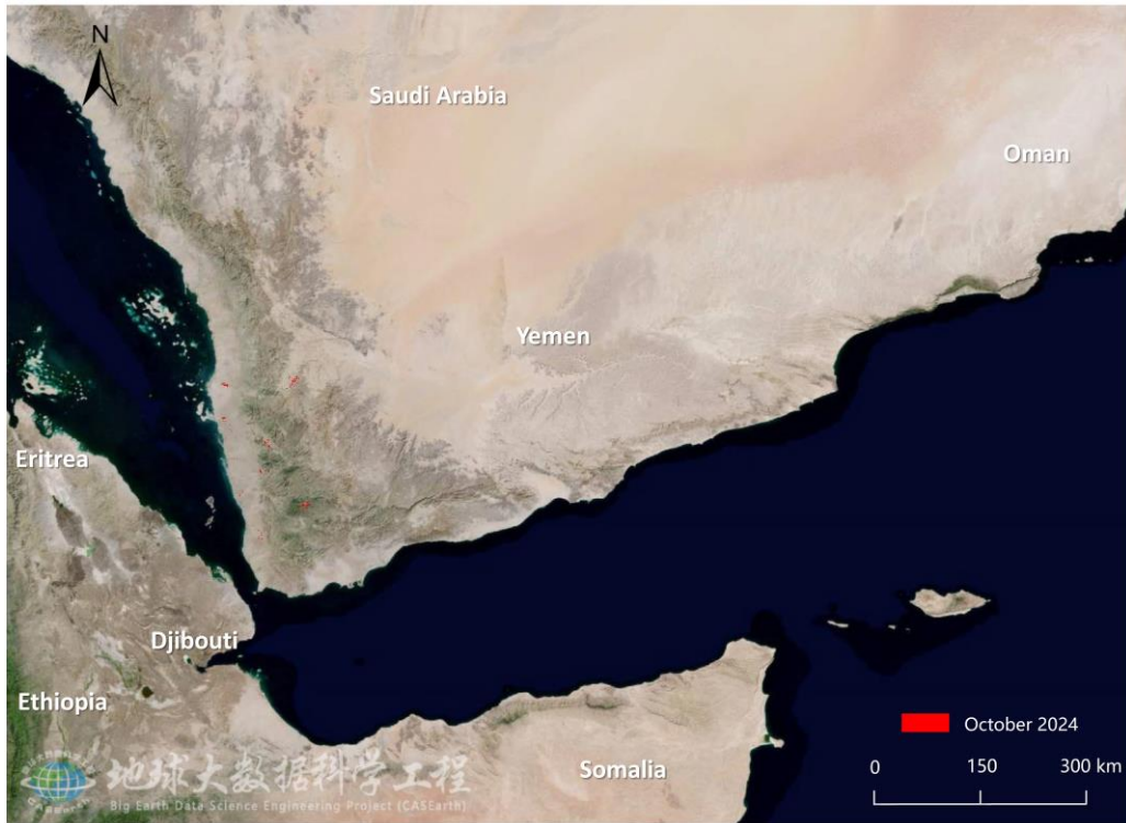
图 3. 也门沙漠蝗危害区域遥感监测图（2024 年 10 月）

综合分析认为，预计未来两个月，亚丁湾沿岸地区的降雨增多，植被长势良好，适宜沙漠蝗生存繁殖，索马里北部亚丁湾沿岸的蝗虫数量将小幅增多；沙特阿拉伯和也门内陆降雨减少，植被干燥，不适宜沙漠蝗生存繁殖，其境内蝗虫将向红海沿岸迁飞，红海沿岸地区的蝗虫数量将进一步增多。建议持续关注索马里、沙特阿拉伯和也门蝗虫动态监测，以防灾情反复对粮食作物生长和农牧业生产造成影响。