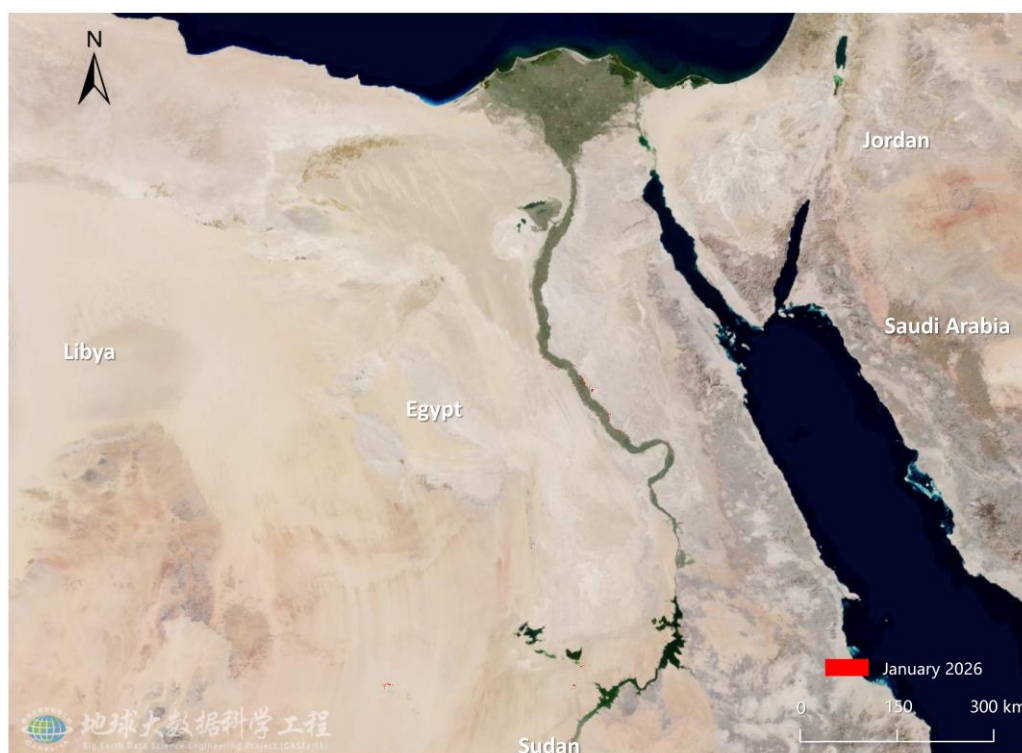
图 1. 埃及沙漠蝗危害区域遥感监测图（2026年1月）

2026年1月，埃及境内整体降水依然有限，适宜生境主要集中在尼罗河上游河谷走廊及其毗邻区域。受生态条件约束，沙漠蝗数量维持在低位，种群活动以局地滞留为主，未表现出明显扩展趋势。监测结果显示，1月沙漠蝗危害埃及植被面积1.57万公顷，其中危害农田0.49万公顷，危害草地0.57万公顷，危害灌丛0.51万公顷（图1），分别占全国农田、草地和灌丛总面积的0.13%、0.42%和0.64%。阿西尤特省（Asyut）植被受害面积最大，为0.56万公顷；其次为新河谷省（New Valley），植被受害面积为0.45万公顷；苏哈杰省（Suhaj）、克纳省（Qina）和阿斯旺省（Aswan）的植被受害面积分别为0.26万公顷、0.16万公顷和0.14万公顷。