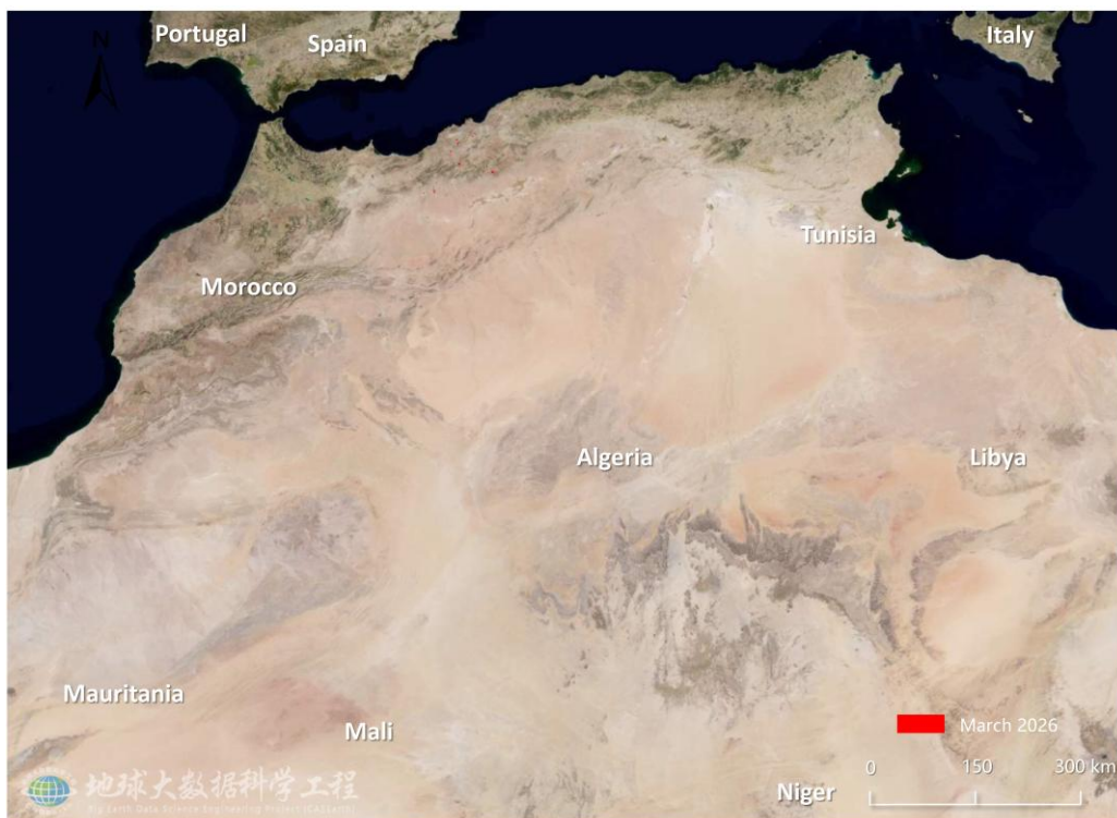
图 2. 阿尔及利亚沙漠蝗危害区域遥感监测图（2026年3月）

2026年3月，阿尔及利亚西北部降雨增多，植被逐步转绿，已具备局地春季繁殖条件；同时受摩洛哥方向少量未成熟成虫输入影响，沙漠蝗活动较上月略有增强，但总体仍为低密度局地发生。监测结果显示，3月沙漠蝗危害阿尔及利亚植被面积2.17万公顷，其中危害农田0.61万公顷，危害草地0.73万公顷，危害灌丛0.83万公顷（图2），分别占全国农田、草地和灌丛总面积的0.40‰、0.58‰和0.32‰。西迪贝勒阿贝斯省(Sidi Bel Abbès)植被受害面积最大，为0.56万公顷；其次为赛伊达省(Saïda)，植被受害面积为0.50万公顷；特莱姆森省(Tlemcen)、艾因特穆尚特省(Aïn Témouchent)、马斯卡拉省(Mascara)和拉格瓦特省(Laghouat)的植被受害面积为0.41万公顷、0.32万公顷、0.21万公顷和0.17万公顷。