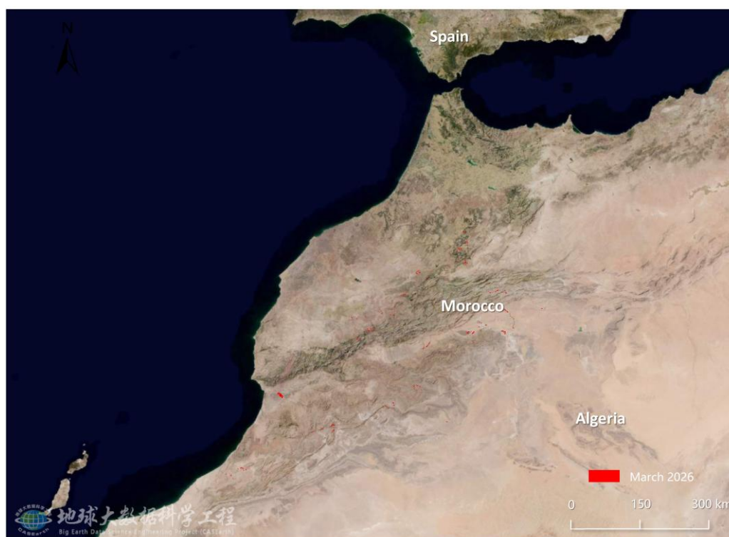
图 1. 摩洛哥沙漠蝗危害区域遥感监测图（2026年3月）

2026年3月，摩洛哥春季降雨持续增加，南部及中部植被条件较好，适宜沙漠蝗产卵繁殖；且受西撒哈拉及摩洛哥南部虫群持续北迁影响，成虫和若虫活动均较活跃，种群水平维持较高。监测结果显示，3月沙漠蝗危害摩洛哥植被面积6.43万公顷，其中危害农田1.07万公顷，危害草地1.89万公顷，危害灌丛3.47万公顷（图1），分别占全国农田、草地和灌丛总面积的0.14%、0.28%和0.25%。梅克内斯—塔菲拉勒特大区（Meknès - Tafilalet）植被受害面积最大，为2.44万公顷；其次为苏斯—马萨—德拉大区（Souss-Massa-Draâ），植被受害面积为1.48万公顷；盖勒敏—塞马拉大区（Guelmim-Es-Semara）、马拉喀什—坦西夫特—豪兹大区（Marrakech-Tensift-Al Haouz）、塔德拉—阿齐拉勒大区（Tadla - Azilal）的植被受害面积分别为1.04万公顷、0.80万公顷和0.67万公顷。